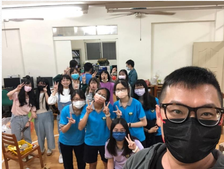
兒童服務勤前教育_華遠兒童中心