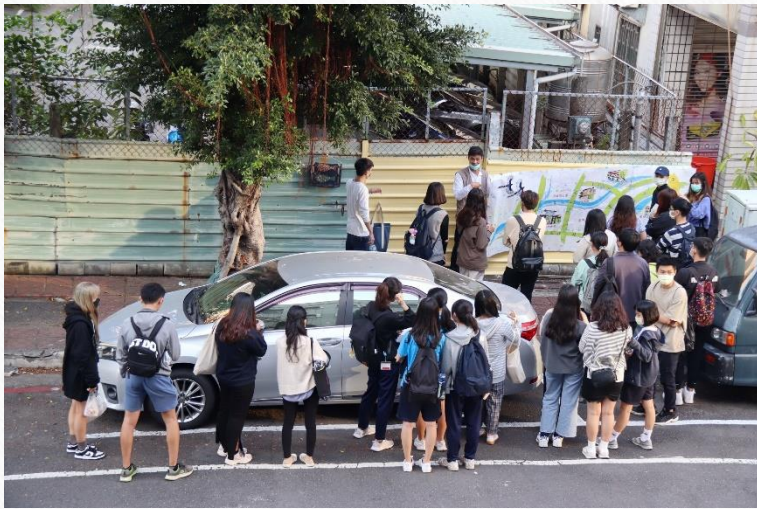
文藻鼎中社區彩繪美學工程前置